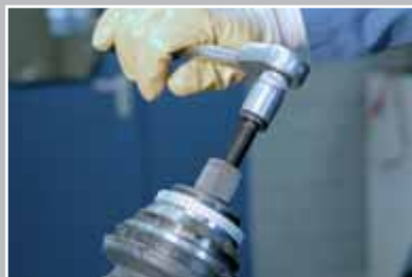
Снимите шарнир с профильного вала.

Профильные валы без резьбы: с помощью пластикового или резинового молотка снять шарнир с профильного вала.