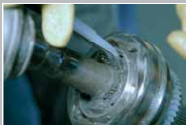
Разожмите стопорное кольцо.

На шарнирах с внутренним (скрытым) стопорным кольцом, постукивая пластиковым или резиновым молотком по торцевой части шарнира, снять шарнир с профильного вала.