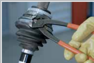
Ослабьте оба хомута.

ВНИМАНИЕ! Не работайте без спецодежды. Падающий инструмент или запчасть могут причинить тяжёлую травму.